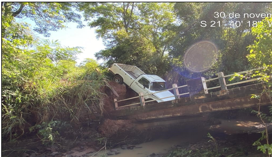
Imagem 5: Travessia caída, do autor em 30/11/2023.

Salmourão/SP, em 26 de Fevereiro de 2024.