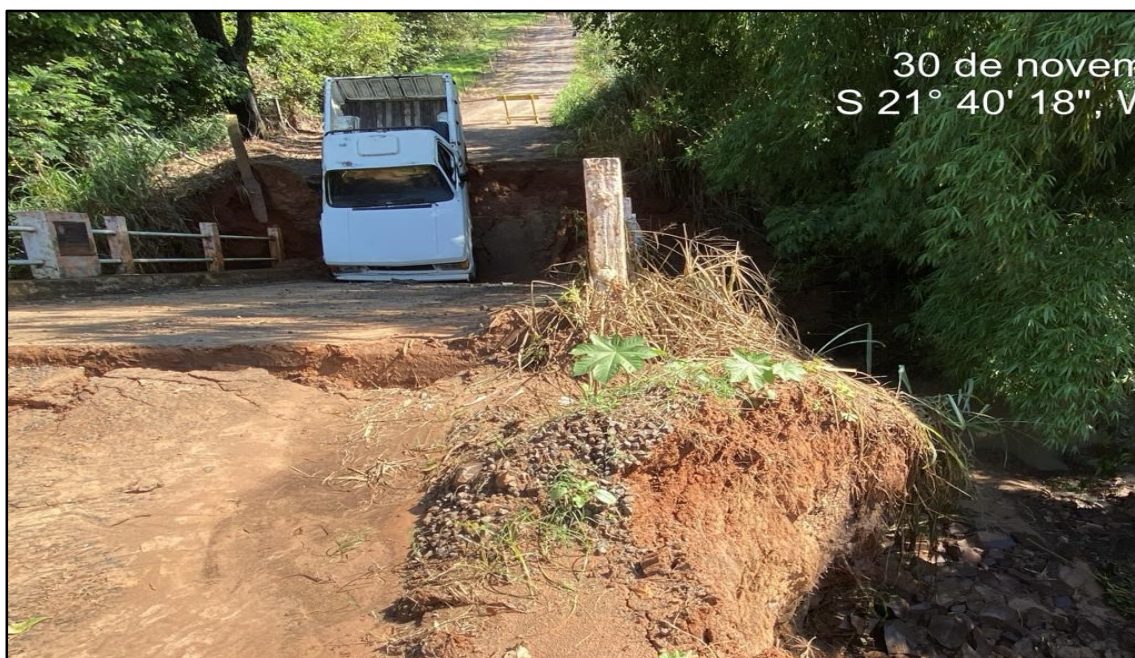
Imagem 4: Travessia caída, do autor em 30/11/2023.