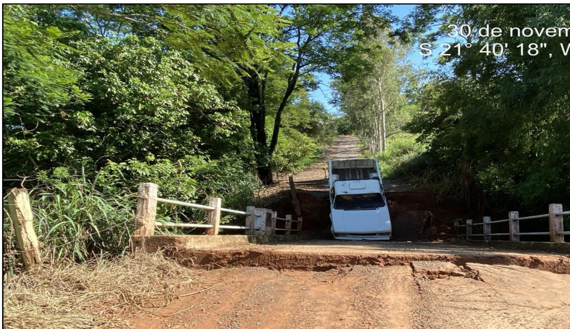
Imagem 2: Travessia caída em 30/11/2023.