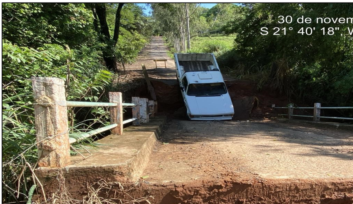
Imagem 3: Travessia caída em 30/11/2023.